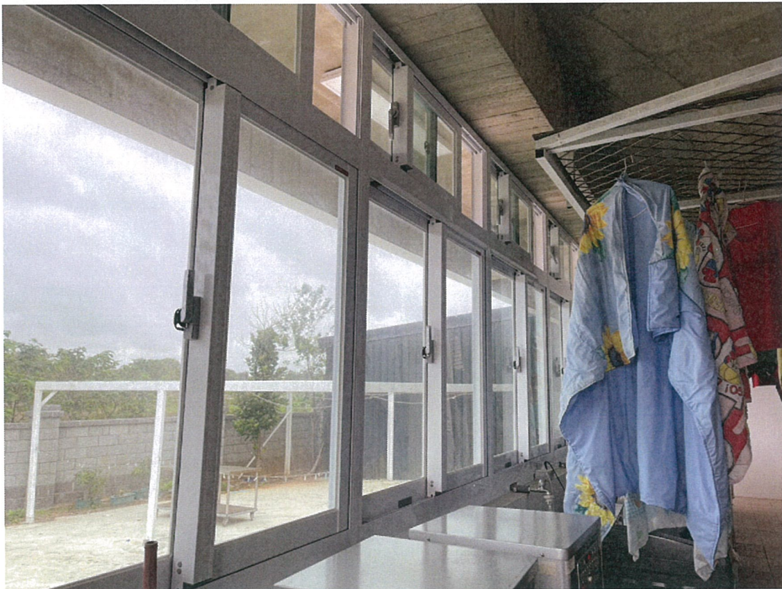
照片：服務對象每日由工作人員陪同在洗衣場進行洗衣、曬衣、收衣及分類的工作訓練，因新屋風大導致場所衣物時常掉落，因此裝設鋁門窗。