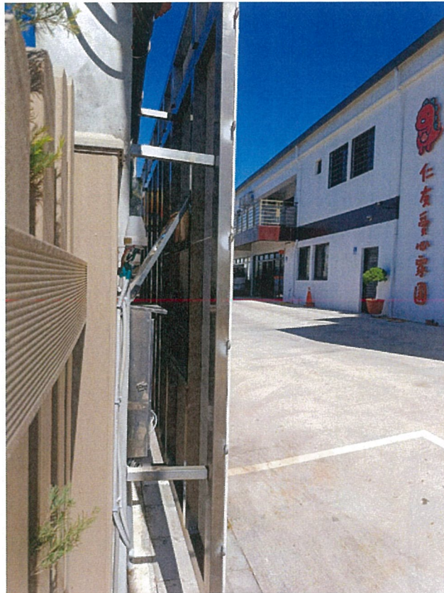
照片：入口旁展示架搭建，將搭配仁友相關主題彩繪 營造溫馨氣氛，穩定服務對象情緒。