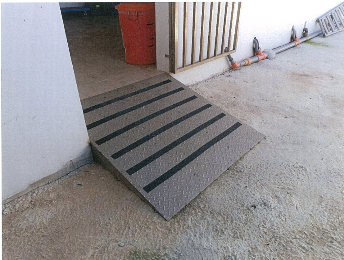
照片：家園內各斜坡設置花板 給服務對象一個更加友善方便的环境。