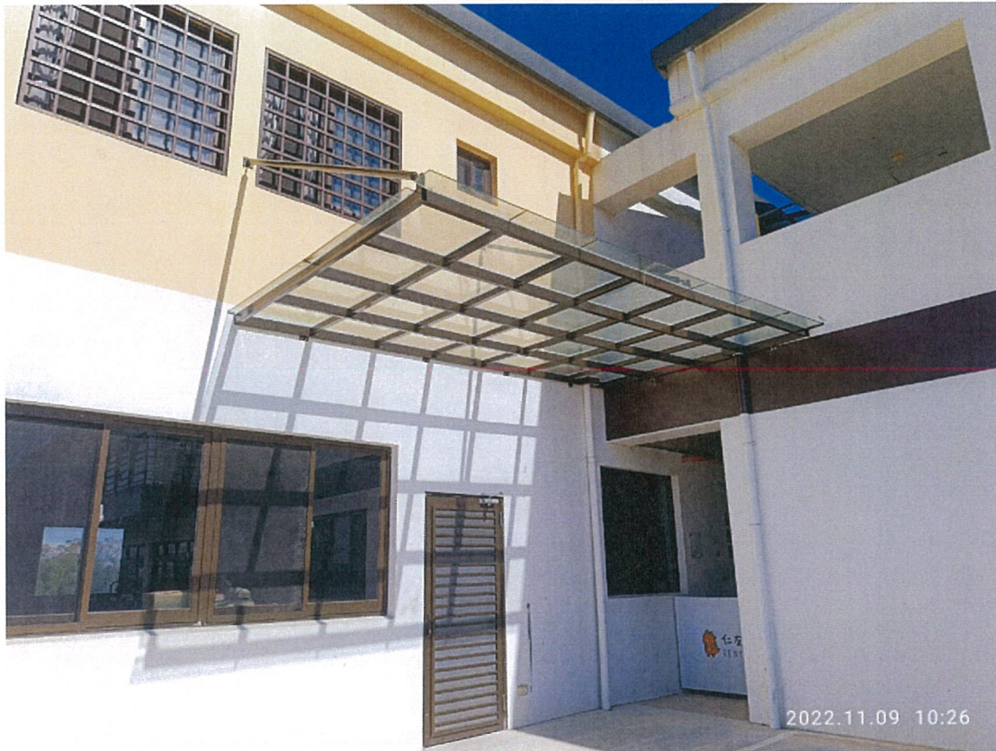
照片：學習教室與體適能教室遮陽棚搭建 給服務對象一個更加友善方便的环境。