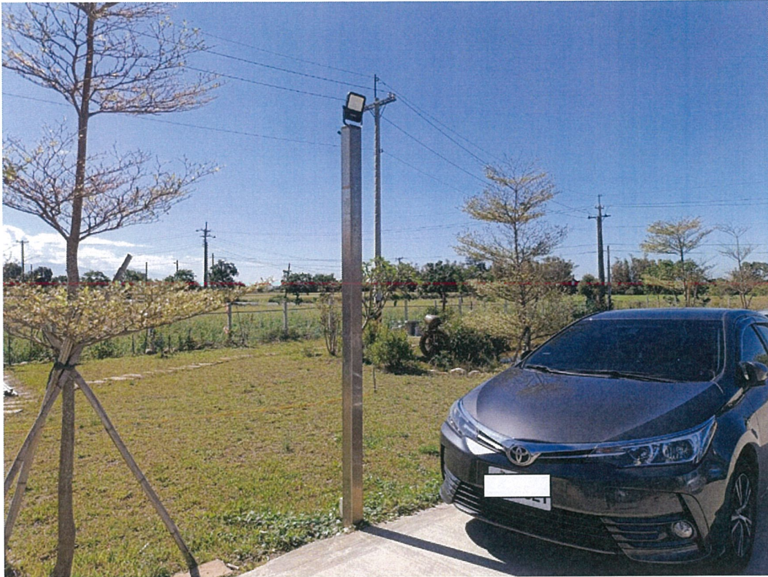
照片：路燈白鐵柱設置，增加夜間照明，增加安全性。