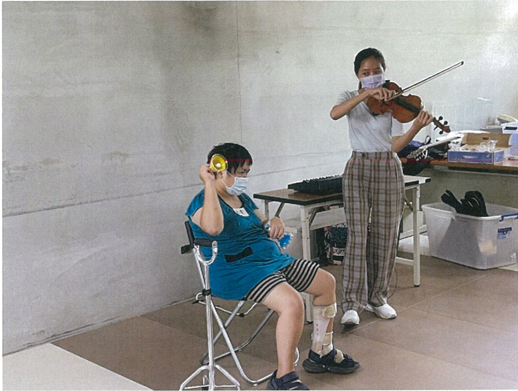
照片：音樂輔療課程。