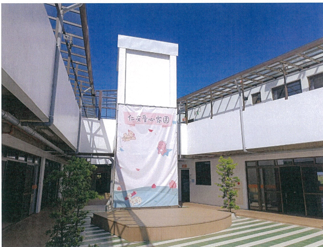
照片：舞台帆布架搭建，搭配仁友吉祥物設計帆布 營造更加溫馨可愛的氣氛。

本年度計畫主要用以維護家園設施設備、添購必需物品及教具教材相關用品，以利執行休閒活動、健康管理…等多元豐富的服務，提升心智障礙者生活品質。經由設施設備的維修，保障居住安全，專業人員在安全的空間使用各式設備執行服務，提供良好的服務品質，滿足服務對象身、心、靈全方面的需求。