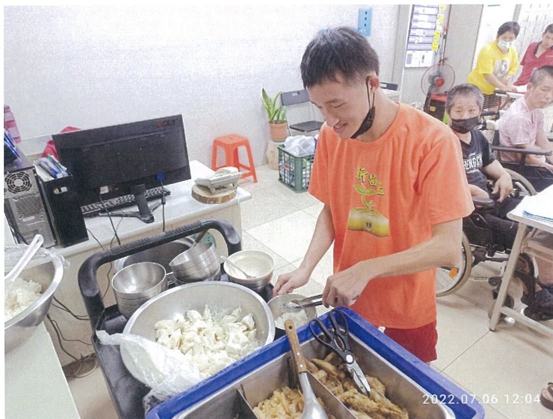
照片：健康三餐，吃飽吃好、營養又美味。