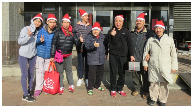
抵達偉明家，迫不及待合照留作紀念！