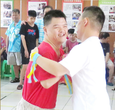
才藝表演的暖身，親子夾夾樂讓家屬與服務對象增加玩樂的互動

除了日常生活照護，服務對象還需要體驗不同的生活型態，因此社團課的誕生可以陶冶性情外，也在過程中讓服務對象培養出不同的興趣，仁友發現了許多服務對象的嗜好與更多不同的可能。