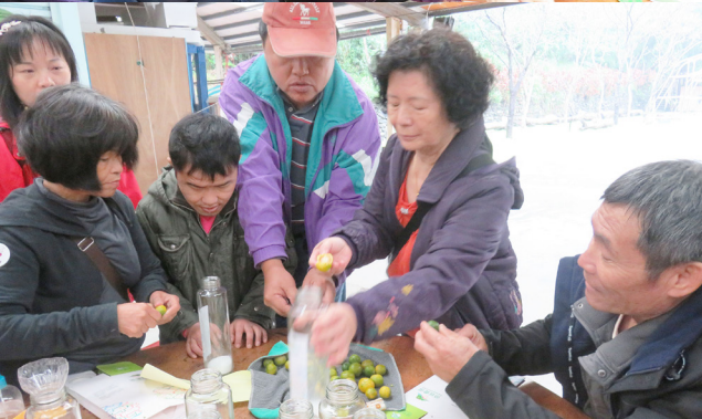
(上圖) 大夥一起彩繪葉子後印在衣服上，體驗不同的創作。