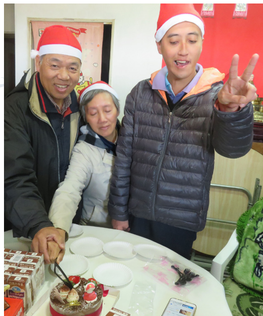
家人齊心切蛋糕，切出幸福的味道。