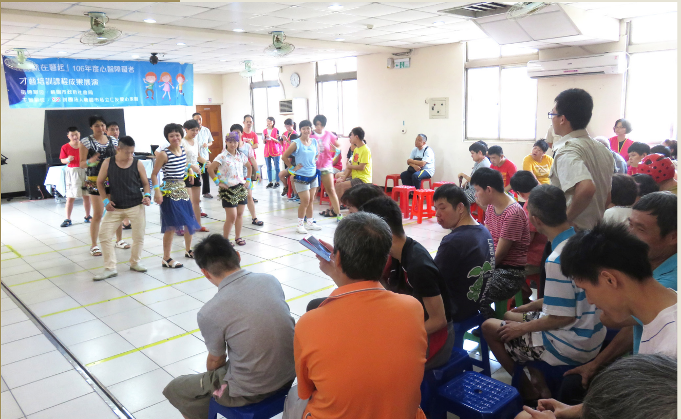
舞蹈社的成員在成果展時，展現他們練習多時準備表演的一面

仁友的社團經過了多元的發展下來，共有超過10種以上的社團選擇，舞蹈、打擊樂、攝影、設計、串珠、點心製作、書法、烏克蘭麗麗、游泳、電腦、說故事社等等。每月第一、二個星期四是上社團的時間，有些服務對象還會特別得期待，會迫不及待先入席準備上課呢！