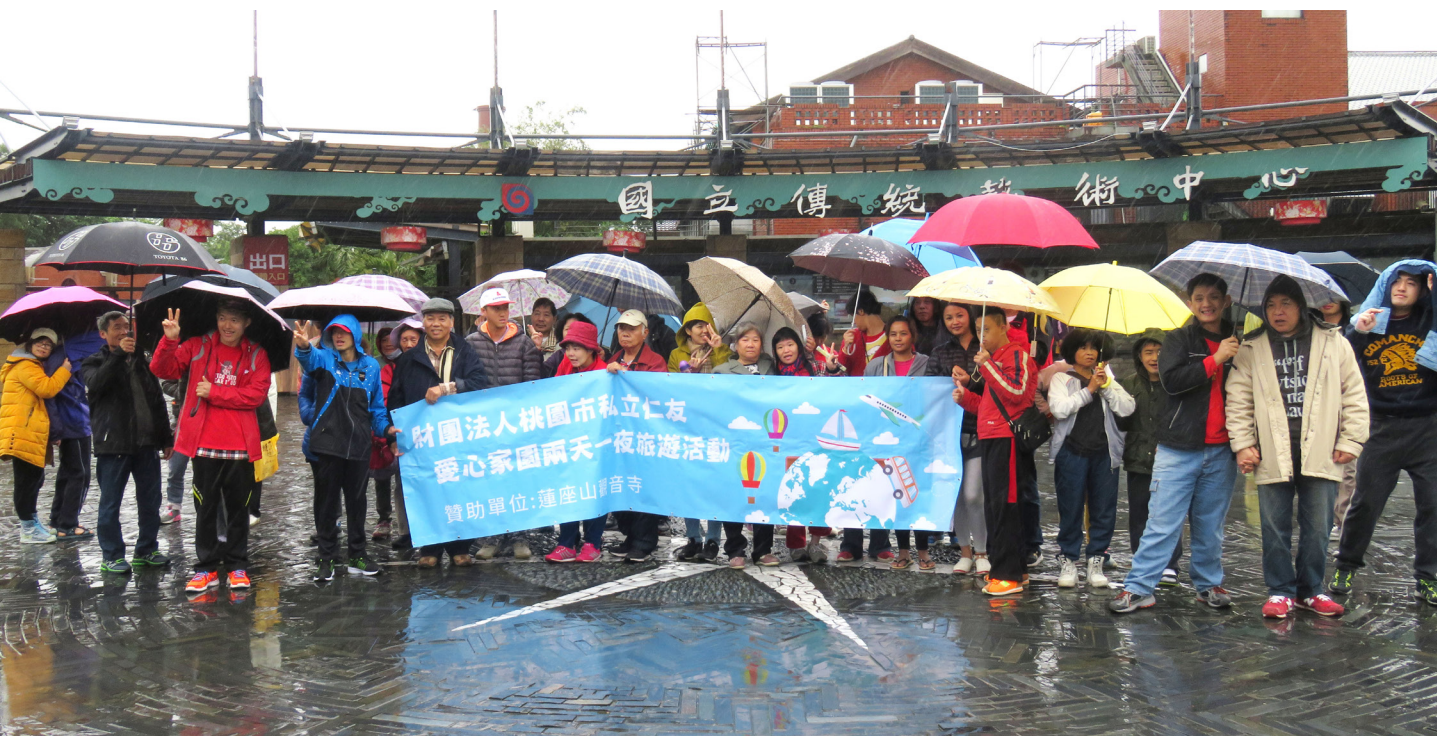
雖然天氣下著雨，大家仍不改興致，開心的繼續旅遊的行程