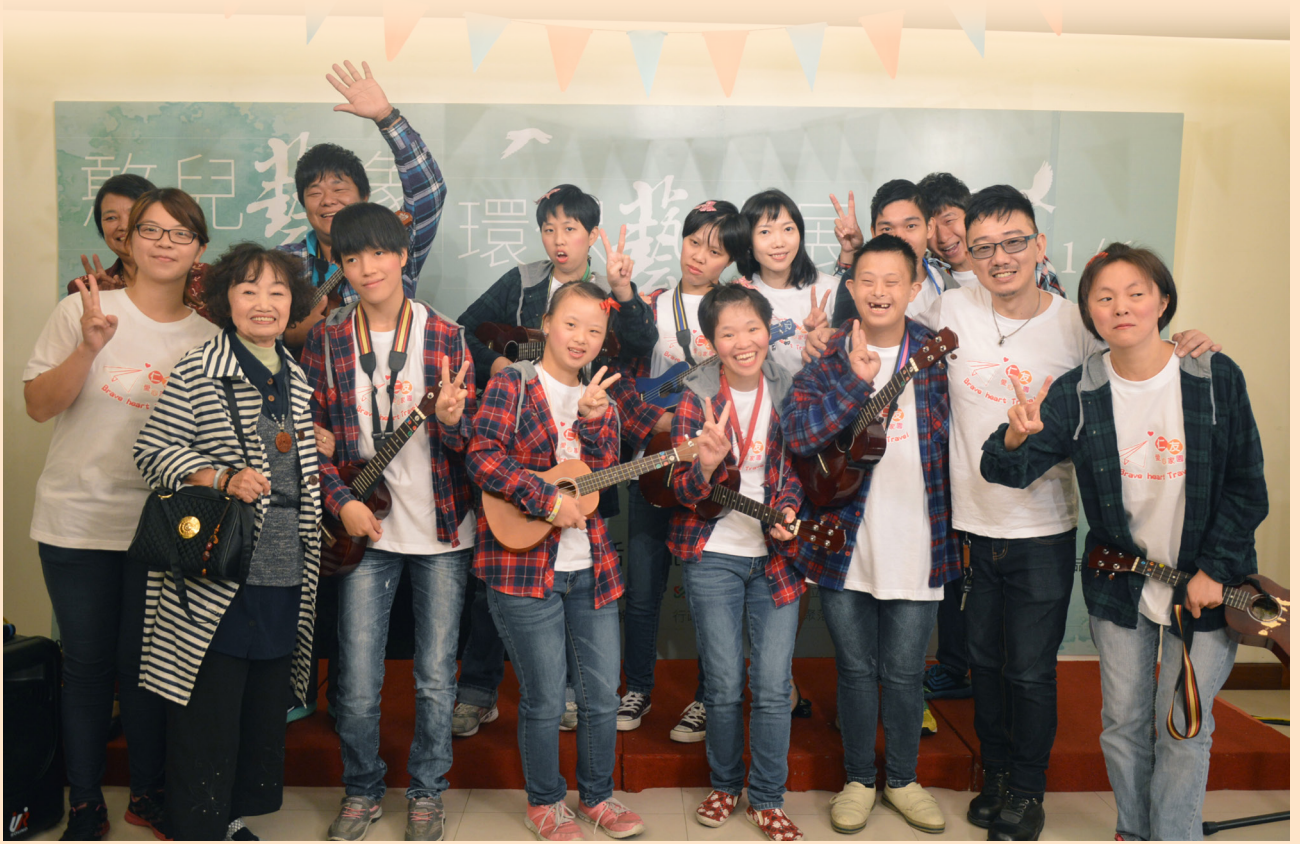
韋明在仁友中是相對聰明的孩子，他時常參與不同的活動，展現他的個人才華