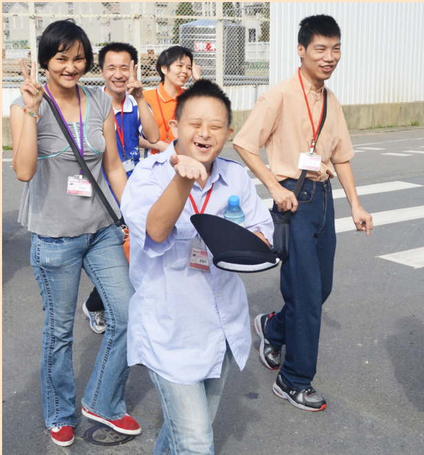
不定期的出外踏青總是讓韋明相當開心

富的肢體語言，彷彿獲得奧斯卡獎般的開心，但容易得意忘形的他，也常因過於興奮而被糾正，這時的他又會露出晴天霹靂椎心刺骨的模樣，如此古靈精怪的反應總是讓老師們好氣又好笑。