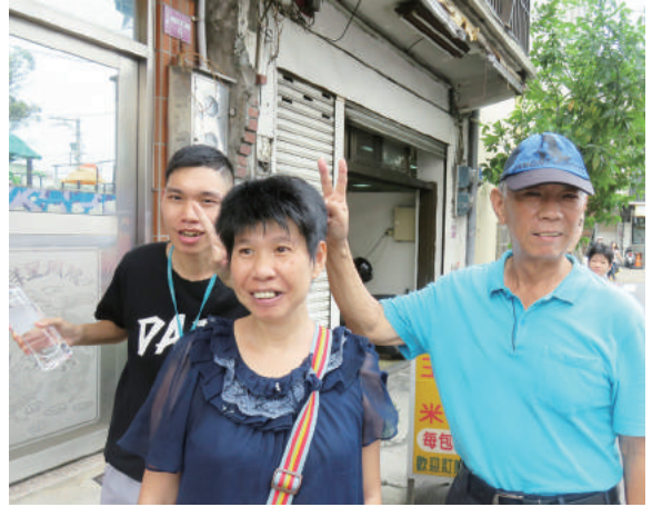
回到家的路上，遇到許久未見的鄰居