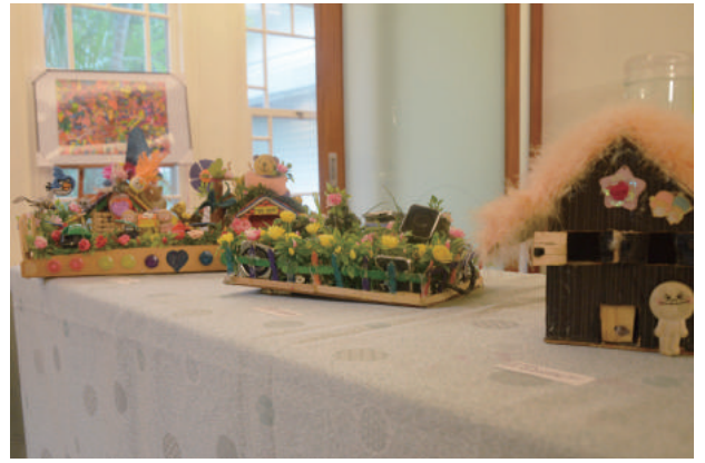
利用許多環保素材做出心目中的家