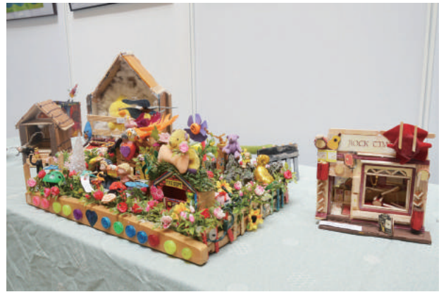
阿勇得意作品之一，想像他要的家與商店