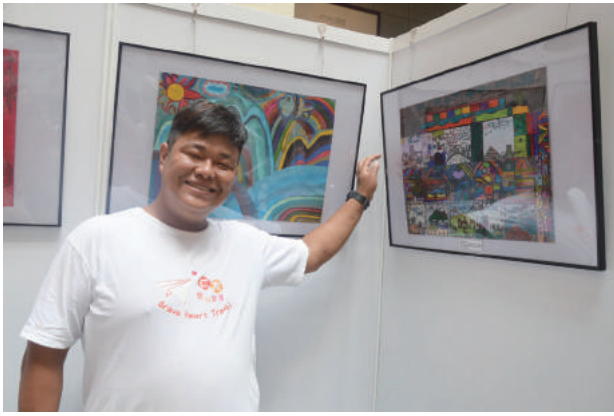
阿勇介紹他的畫作給大家認識