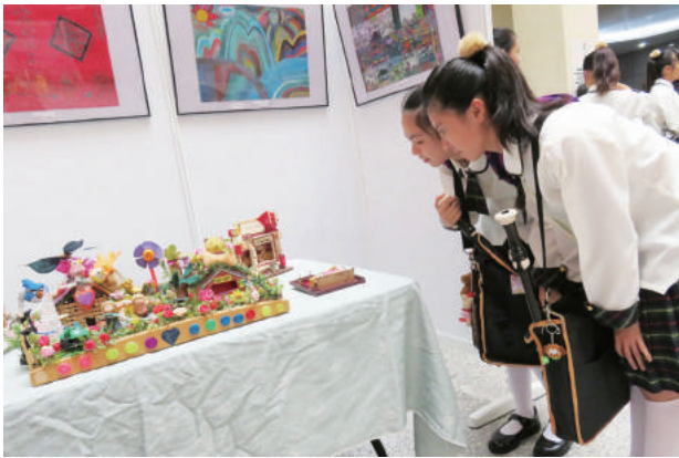
民眾認真的觀賞阿勇的作品