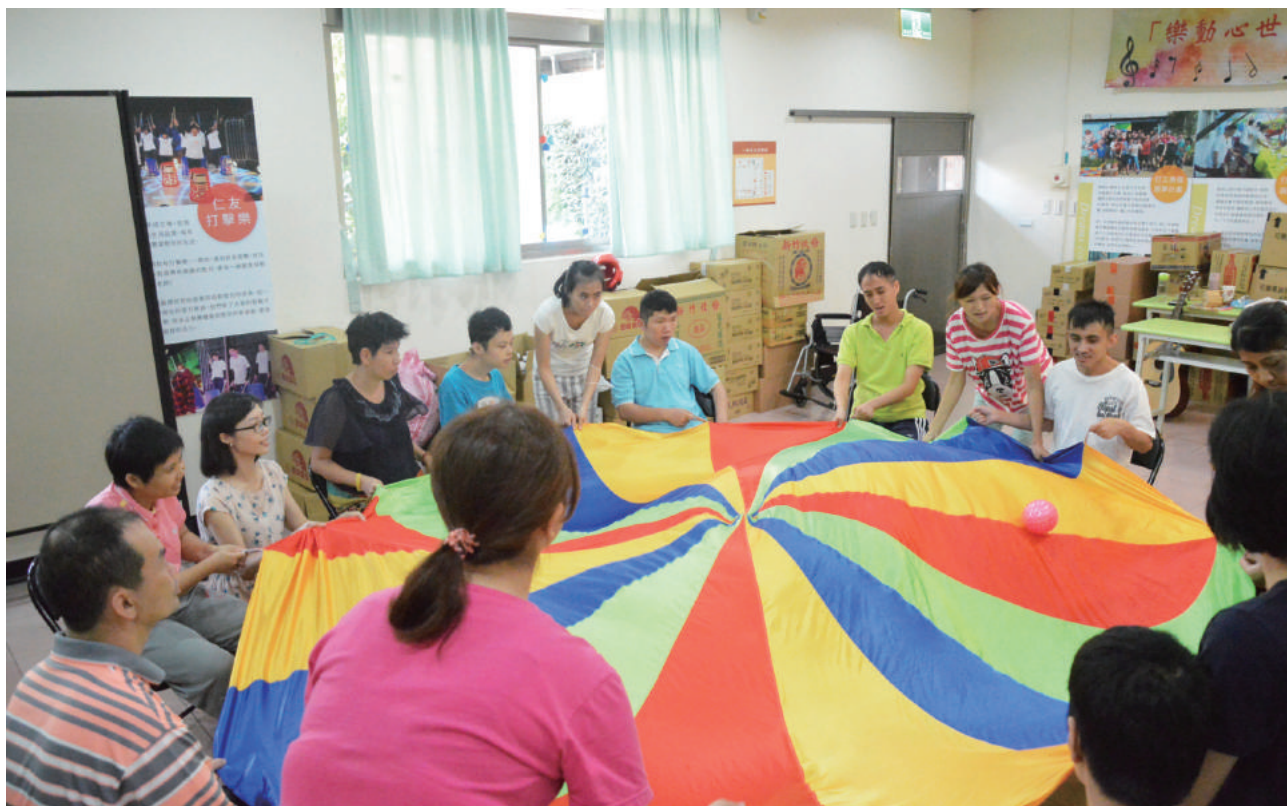
第一次接觸氣球傘，服務對象皆感到非常新奇，玩得不亦樂乎

是請他們大聲地唱出歌曲，服務對象也毫不扭捏地張大嘴唱著，沉浸在音樂的美好世界中；較活潑的服務對象，更是時常舉手表示想要上台演唱，讓整個團體充滿歡樂。