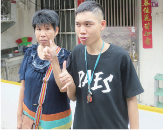
帶著服務對象回到他們的家，有說不完的回憶